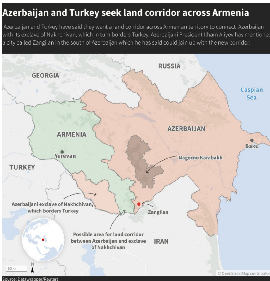
Fig. 2 – Nakhichevan, Corredor de Zangezur e Nagorno-Karabakh, 2023a.

Segundo o presidente azeri, Ilham Aliyev, construir um corredor que ligue o Azerbaijão ao Nakhichevan é essencial para segurança e para lograr metas econômicas da nação (Azertac 2022). O corredor mencionado pelo presidente do Azerbaijão costuma ser nomeado como Zangezur, que teria que passar por Syunik, território internacionalmente reconhecido como parte da Armênia. Em setembro de 2024, os iranianos solicitaram à Rússia que não prestasse suporte à criação do corredor de Zangezur, tendo em vista que o Irã perderia sua projeção à Europa, tendo ameaçada sua segurança (Falardo 2024).