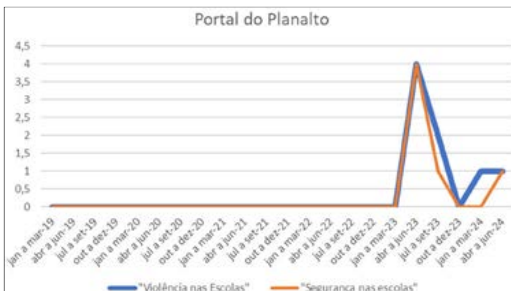
Gráfico 1 – Notícias sobre políticas públicas envolvendo a redução da violência escolar encontradas no portal do Planalto