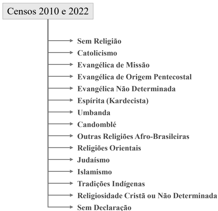
Figura 2 – Classificação das religiões nos Censos de 2010 e 2022

o estado brasileiro, como signatária da escravidão. Autores como Sanchis (1994) e Ferretti (1998) aprofundaram o debate sobre sincretismo. Esse último assinala o caráter de resistência das religiões afro-brasileiras, tanto no sentido de “disfarçar as crenças africanas por trás de uma máscara colonial católica” para sobreviver às perseguições, como no de buscar romper com o sincretismo, acionando processos de reafricanização (Ferretti 1998, 185), principalmente no candomblé. Assim, sincretismos e reações são temas que percorrem a tentativa de compreensão do fenômeno religioso no país.