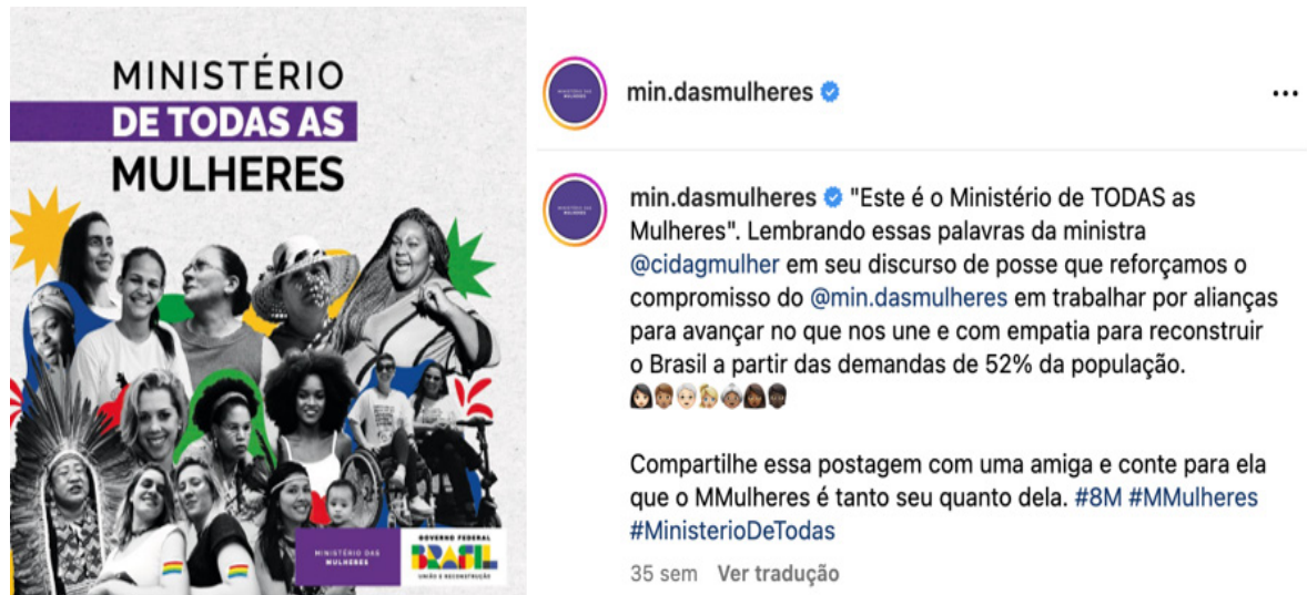
Figura 2 – Publicação de 15 de fevereiro de 2023 do Ministério das Mulheres com a frase "Ministério de Todas as Mulheres".