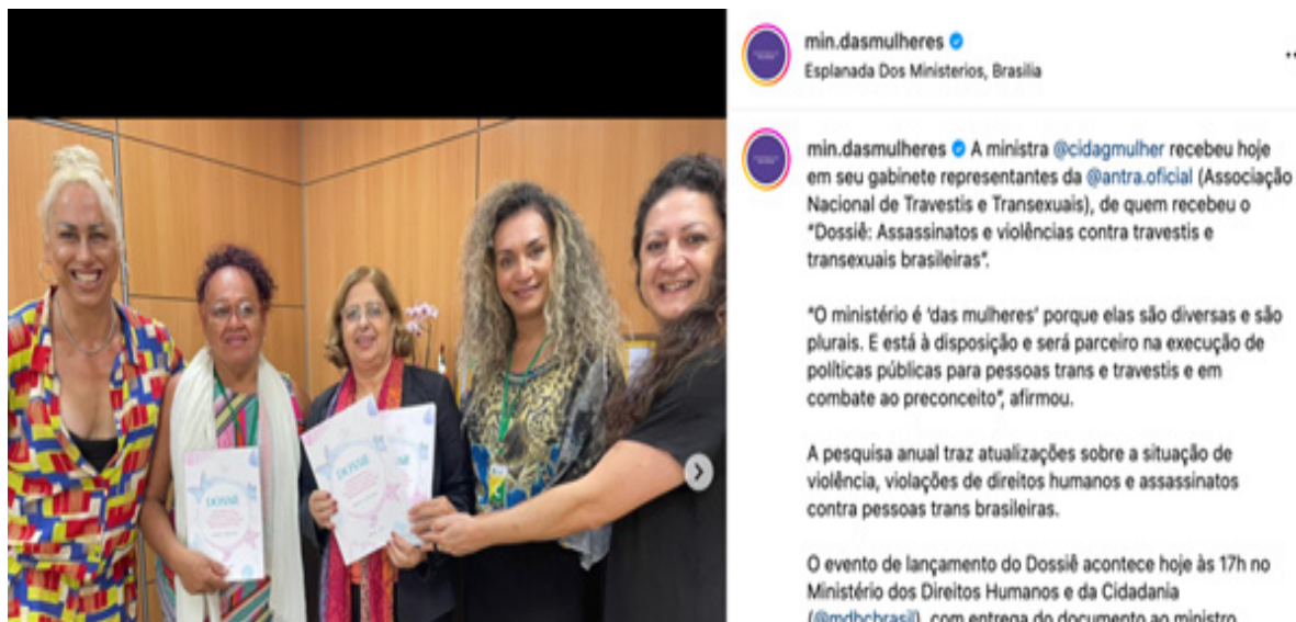
Figura 1 – Ministra das Mulheres Cida Gonçalves recebendo representantes da Associação Nacional de Travestis e Transexuais (Antra), 2023