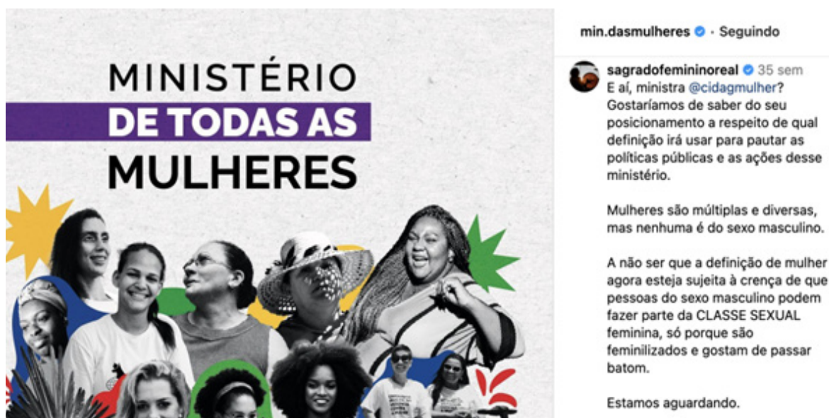
Figura 3 – Comentário da página Sagrado Feminino Real no "post do Ministério de Todas as Mulheres" (Figura 2) publicado em 15 de fevereiro de 2023.