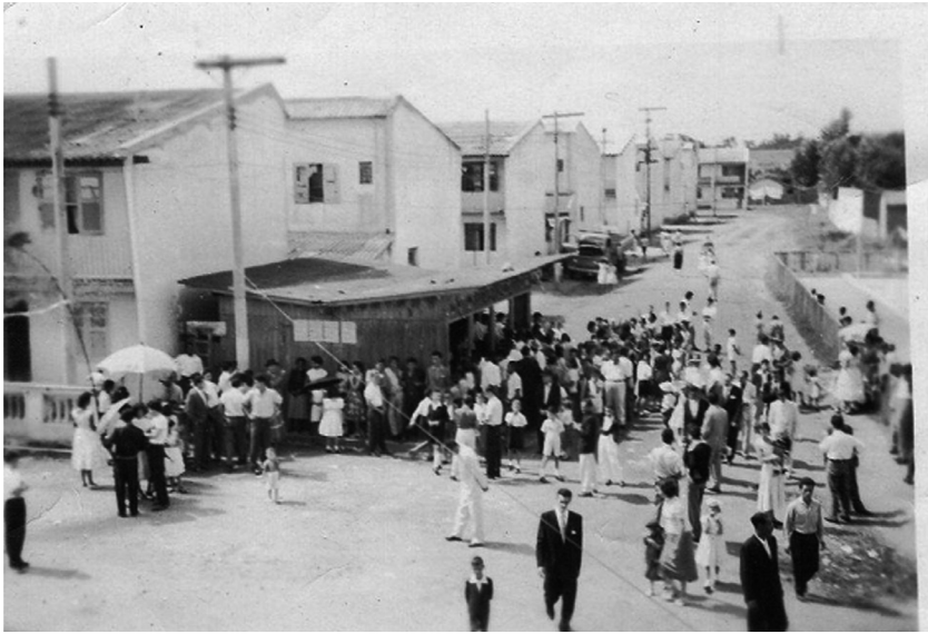
Foto 1. Vila Popular durante confraternização da década de 60.

Os sobrados tinham originalmente 3,75m por 10m e quintal de 16m 2 , dois quartos e banheiro na parte superior e sala cozinha e quintal na parte inferior. Hoje alguns foram alterados e outros completamente demolidos para a construção de uma nova casa, porém no mesmo lote. A vila foi projetada originalmente para operários da região, mas muitos ferroviários se instalaram lá. Em sua composição original, podemos perceber o fenômeno da migração interna, pois muitos dos moradores vieram do interior de São Paulo, atraídos pela oportunidade de emprego das indústrias do ABC e também devido à crise cafeeira. 1