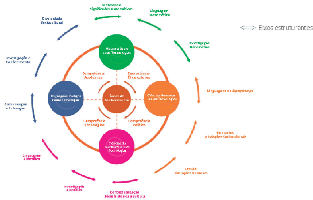
Figura 2. Diagrama síntese das áreas do conhecimento.