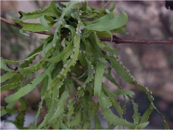
Figura 7. Talo foliáceo do gênero Ramalina .