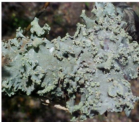
Figura 5. Talo foliáceo do gênero Parmotrema .