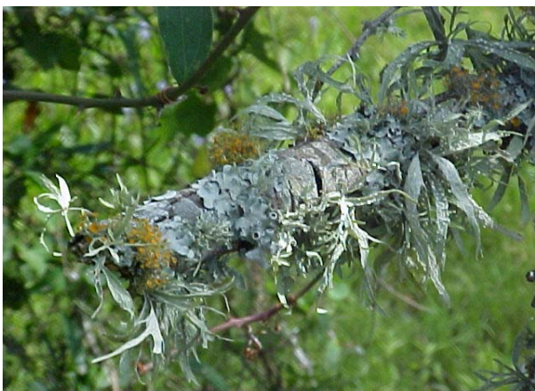
Figura 1. Aspecto da comunidade Liquênica.