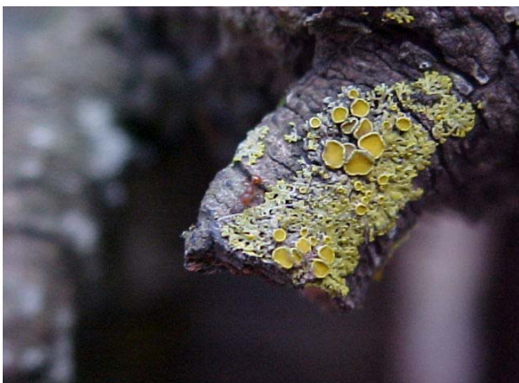
Figura 3. Talo foliáceo do gênero Candelaria .