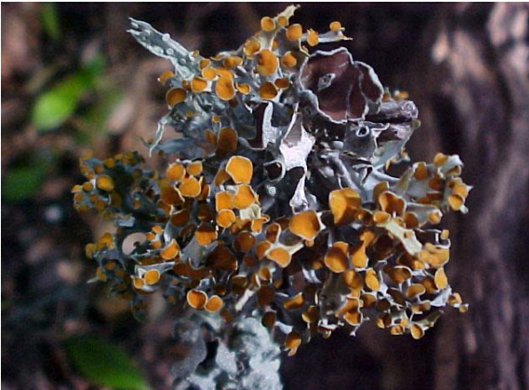
Figura 8. Talo foliáceo do gênero Teloschistes .