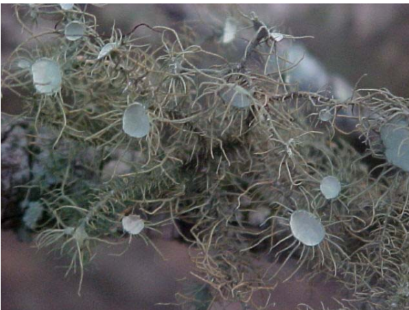
Figura 9. Talo foliáceo do gênero Usnea .