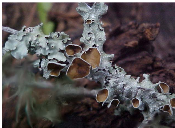
Figura 6. Talo foliáceo do gênero Punctelia .