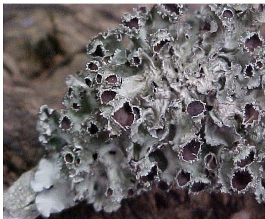
Figura 4. Talo foliáceo do gênero Canomaculina .