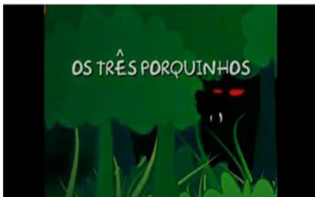
Figura 1 – Vídeo “Os três porquinhos em Libras” veiculado no Espaço de Aula