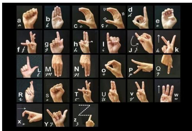
Figura 3 – Alfabeto em Libras – Imagem veiculada na aula “Deficiência Auditiva: entendendo como se formam os sons e como os captamos”