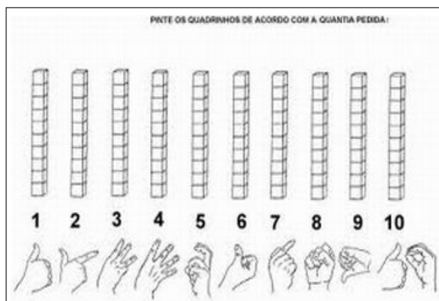
Figura 2 – Atividade de leitura do numeral em LIBRAS na aula “Aprendendo a se comunicar usando as mãos”