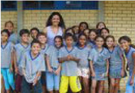
Figura 5 – Matéria “Língua de Sinais ajuda escola a melhorar rendimento de estudantes” veiculada no Jornal do Professor