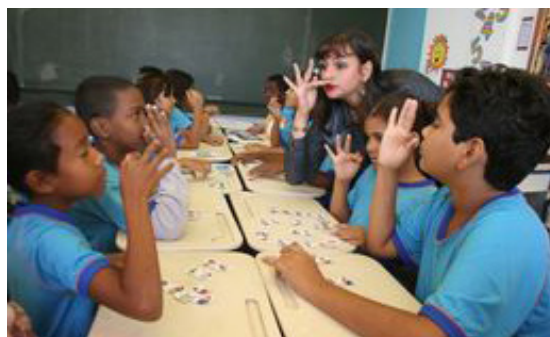
Figura 4 – Matéria “Aulas de Libras mudam comportamento de alunos ouvintes” veiculada no Jornal do Professor