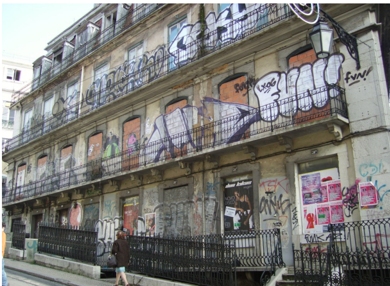
Figura 2 – Edifício com graffiti ilegal, Bombing (Lisboa).