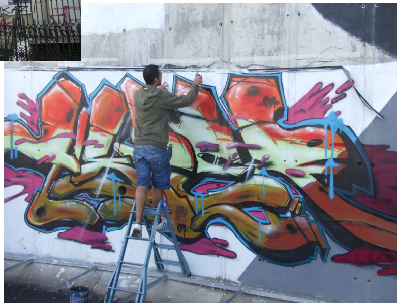
Figura 3 – Pintura de um Hall of Fame (Lisboa).