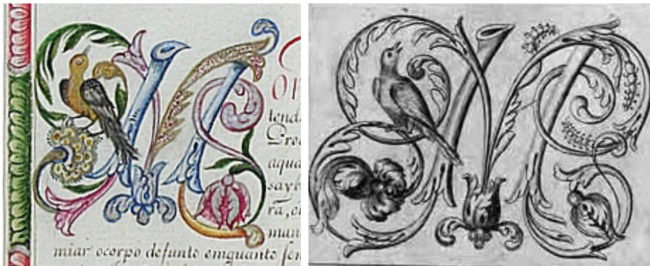
Figura 3 – Capitular M do Compromisso da Irmandade de São Miguel e Almas da Matriz de Nossa Senhora do Pilar (Ouro Preto) e modelo apresentado por Manoel de Andrade de Figueiredo.

Há vários padrões de ornamentação de manuscritos swg" guv- q" r t g u g p v g u" p c" r t q f w ±- q" u g v g e g p v k u v c" g o" O k p c u." g" w o" f g n g u" k p g i c x g n o g p v g" h q k" c s w g n g" r t q r i c f q" p c" q d t c" f g" O c p q n" f g" C p f t c f g" f g" H k i w g k t g f q" C r » u" c" k f g p v k L e c ±- q" g" e n c u u k L e c ±- q" f c u" n g v t c u" e c r k v w n c t g u" w v k n k | c f c u" g o" q p | g" Compromissos de irmandades da região central de Minas I g t c u" f w t c p v g" q" u 2 e w n q" Z X K K K" * C n o c f c" 4 2 2 8." e c r" v w n q" 5+. eqpuvcvc o qu" q" wuq" tghgtgpekcn" fktgvq" *eq o q" o qfgnq+" qw" kpftkvq" *kpurkct±-q+" g o" f q e w o g p v q u" f c u" u g i w k p v g u" n q e c n k f c f g u" Eq p i q p j c u" f g" U e d c t a ." D q o" U w e g u u q" f q" E c g v 2 ." U c p v q" C p v 1/2 p k q" f q" T k q" C e k o c." X k n c" T g c n" f g" U e d c t a " e Vila Rica. Alguns exemplos podem ser observados nas H k i w t c u" 5" g" 6)