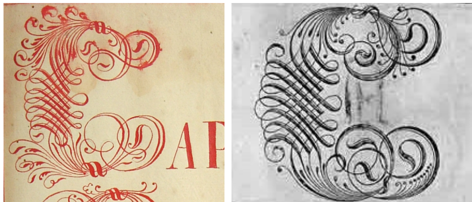
Figura 4 – Capitular C do Compromisso da Irmandade do Santíssimo Sacramento de Nossa Senhora do Bom Sucesso de Caeté e o modelo de Manoel de Andrade de Figueiredo. Fonte: Acervo Arquivo Público Mineiro e Figueiredo. Nova Escola para Aprender a Ler, Escrever e Contar, gravura n° 37.