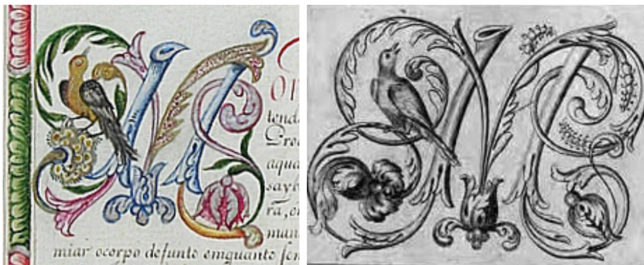
Figura 3 – Capitular M do Compromisso da Irmandade de São Miguel e Almas da Matriz de Nossa Senhora do Pilar (Ouro Preto) e modelo apresentado por Manoel de Andrade de Figueiredo.

Há vários padrões de ornamentação de manuscritos swg" guv -q" r t g u g p v g u" p c" r t q f w ±- q" u g v g e g p v k u v c" g o" O k p c u." g" w o" f g n g u" k p g i c x g n o g p v g" h q k" c s w g n g" r t q r i c f q" p c" q d t c" f g" O c p q n" f g" C p f t c f g" f g" H k i w g k t g f q" C r » u" c" k f g p v k L e c ±- q" g" e n c u u k L e c ±- q" f c u" n g v t c u" e c r k v w n c t g u" w v k n k | c f c u" g o" q p | g" Compromissos de irmandades da região central de Minas I g t c u" f w t c p v g" q" u² e w n q" Z X K K K" * C n o c f c" 4 2 2 8." e c r" v w n q" 5+. eqpuvcvc o qu" q" wuq" tghgtgpekcn" fktgvq" *eq o q" o q f g n q" q w" k p f k t g v q" *k p u r k t c ±- q" g o" f q e w o g p v q u" f c u" u g i w k p v g u" n q e c n k f c f g u" Eq p i q p j c u" f g" U e d c t .". D q o" U w e g u u q" f q" E c g v²." U c p v q" C p v ½ p k q" f q" T k q" C e k o c." X k n c" T g c n" f g" U e d c t .". e Vila Rica. Alguns exemplos podem ser observados nas H k i w t c u" 5" g" 6)