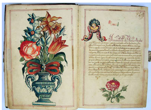
Figura 2 – Termo de Abertura do Compromisso da Irmandade de Nossa Senhora do Rosário dos Pretos da Matriz de Nossa Senhora do Pilar de Vila Rica [1750].

Os Compromissos são os estatutos das agremiações ngki cu" g. g o" i gtcn." qti cpk | cxc o" c" xkfc" uqekcn" g" tgnki kquc" das comunidades. Algumas cópias desses documentos crtgugpvxc o /ug" uqd" c" hqt o c" fg" fqew o gpvqu" o cpwuetkvqu" eq o" ecnki tc h Ec" gncdqtcfc." gpecfgtpcfqu" eq o" o cvgtcku" pqdtgu." i gtcn o gpvg" fgeqtcfgu" eq o" knw o kpwtcu" eqnqtfcu." htqpvkur h ekqu" eq o" keappq i tc h Ec" gurge h Lec" fc" fgxq±" q." ecrkvwntgu" g" xkpvj gvcu" eq o" knwvvtc±" g" u" fgeqtcvxcu" *Hki 0 h 4+0