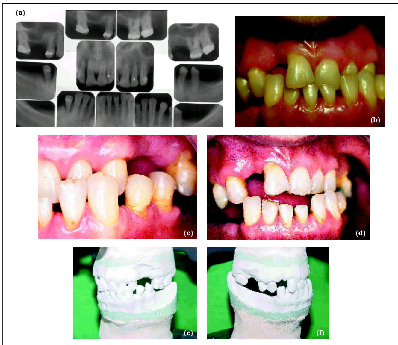
Figura 2 – Caso Clínico II: (a) levantamento radiográfico periapical; (b) vista anterior; (c) vista lateral do paciente em máxima intercuspidação habitual; (d) vista anterior em posição de relação cêntrica. (e) lado esquerdo; (f) lado direito dos modelos montados em articulador semi-ajustável.