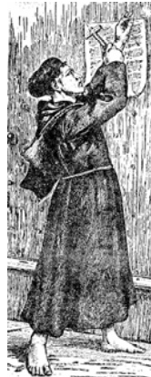
Imagem 6 ( Mensageiro Luterano , out. 1972, p. 7)