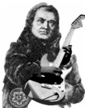
Imagem 10 (recriada por Priscila Bueno, a quem o autor agradece)

Isso foi também o que fizeram alguns jovens da Ielb no final dos anos 90, por ocasião do Lutherstock (Imagem 10), festival de bandas gospel inspirado no estadunidense Woodstock, porém sem o sexo e as drogas, somente o rock'n'roll . Este, contudo, é um outro olhar e uma outra história.