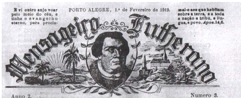
Imagem 4 ( Mensagem Luterana , 1 fev. 1919, p. 1)

montes se estendem, nasce o sol. Nos pés dos montes correm as águas cristalizadas e nos matos os passaros cantam. Eis o solo bemdito do Brasil! Nesta terra, os ministros de Deus, tem um vasto território para trabalhar, para pregar o evangelho [sic].