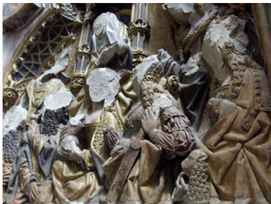
Imagem 1

Veja-se, por exemplo, a ironia, conforme Jan de Vries, de que a cultura holandesa do século 17, moldada fortemente pelo Calvinismo, com sua primazia dos textos sagrados e da palavra como meio de comunicação e sua completa rejeição de imagens sagradas, “tenha deixado imagens visuais – pinturas – como seu mais duradouro e influente legado” (Vries, 1991, p. 2). 1 Ou veja-se também, no mesmo sentido, o iconoclasmo registrado nos “santos degolados” pelos protestantes durante a Reforma na catedral de Utrecht (Imagem 1), que anunciam antes a força comunicativa da imagem que sua debilidade.