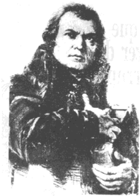
Imagem 5 ( Mensageiro Luterano , jun. 1967, p. 9)

A cultura visual acerca de Lutero na época, facilitada pelas novas tecnologias de impressão, mostrava o mesmo homem forte e intrépido, que segurava a Bíblia junto ao peito (Imagem 5), ou afixava corajosamente suas “95 teses” à porta da Igreja de Wittenberg (Imagem 6). Como veremos, porém, novos conteúdos seriam projetados sobre essas imagens.