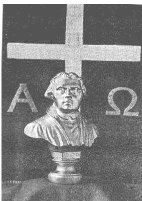
Imagem 7 ( Mensageiro Luterano , out. 1971, p. 9)

Na foto, o “alfa” e o “ômega” representam a idéia de que Cristo é o princípio e o fim de todas as coisas, conforme a tradição bíblica. Lutero, por sua vez, era, como antes, o fator de convergência do correto ensino de Jesus e da verdadeira palavra de Deus, da qual a Ielb era a portadora.