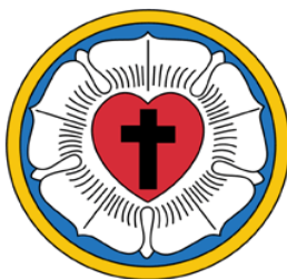
Imagem 2:

Talvez a “rosa de Lutero” seja uma interessante imagem (2) para começarmos, uma vez que o próprio reformador a criou e explicou. A imagem e o texto abaixo estão publicados no site oficial da Ielb.