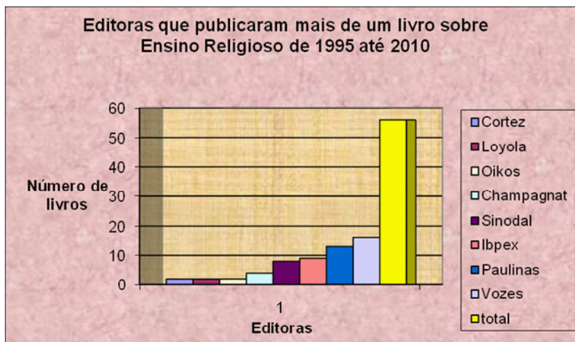
GRÁFICO 04 – Editoras que publicaram mais de um livro sobre Ensino Religioso de 1995 até 2010.