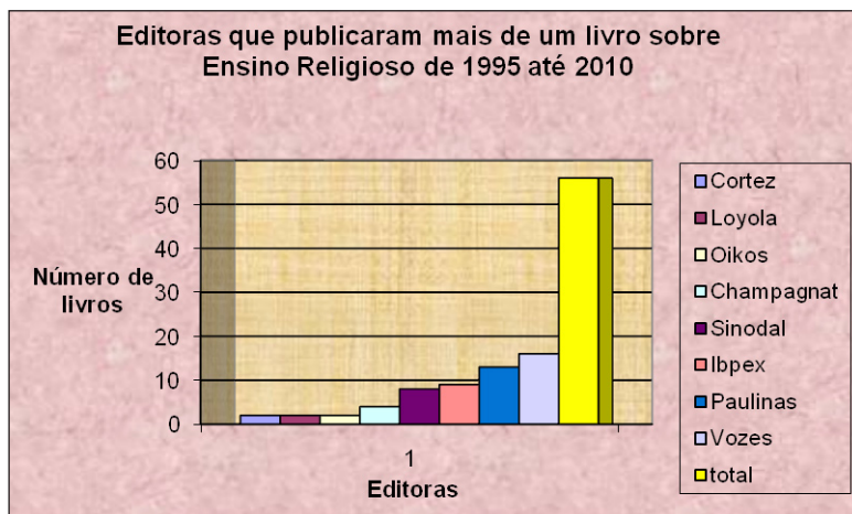
GRÁFICO 3 – Editoras que publicaram um livro sobre Ensino Religioso de 1995 a 2010.

Especificamente a FTD criou nos anos de 1990 a oficina de professores e um boletim de apoio a docentes; como consequência, foi fundada a Biblioteca do Ensino Religioso na perspectiva confessional teológica. A Editora Vozes, por meio de seu departamento editorial, promoveu a divulgação do modelo fenomenológico ao apoiar reuniões do Fórum Nacional Permanente do Ensino Religioso, assim como a publicação de duas coleções específicas para subsidiar a formação docente. A Editora Paulinas gerou reunião de professores; assim como promoveu e ainda promove em suas livrarias palestras de apoio ao Ensino Religioso, além de divulgar a proposta desta disciplina em sua revista Diálogo. A Editora Sinodal na realidade é uma publicadora vinculada a uma Instituição de Ensino Superior. Muitas de suas publicações são na realidade Anais de Eventos. Finalmente a Editora IBPEX publicou uma coleção de apoio a um curso de especialização, porem não faz parte de sua linha editorial.